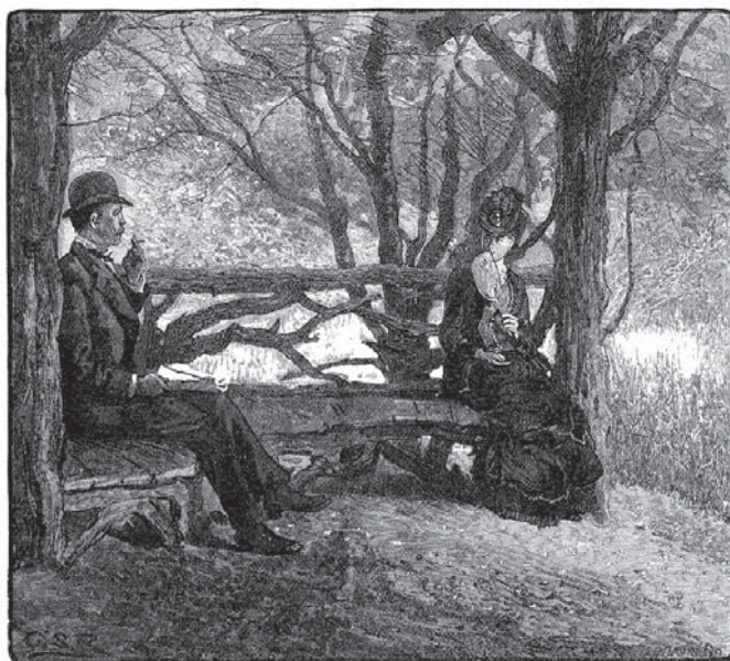
FIGURA 2 | "Un flirteo [en la] Rambla, donde se concentra el romance de Central Park".