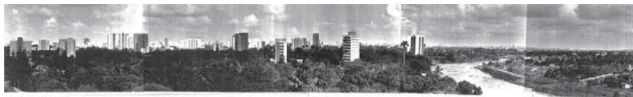
FIGURA 1 | Conjunto urbano de Casa Forte - Recife

FONTE ATLAS DE DESENVOLVIMENTO HUMANO DO RECIFE, 2005. DADOS DOS CENSOS DEMOGRÁFICOS DE 1991 E 2000.