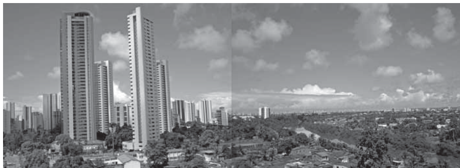
FIGURA 2 | Conjunto urbano de Casa Forte - Recife